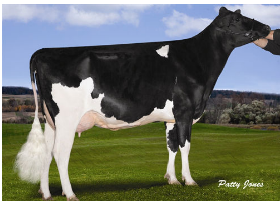
STANTONS FREDDIE CAMEO FOURTH DAM